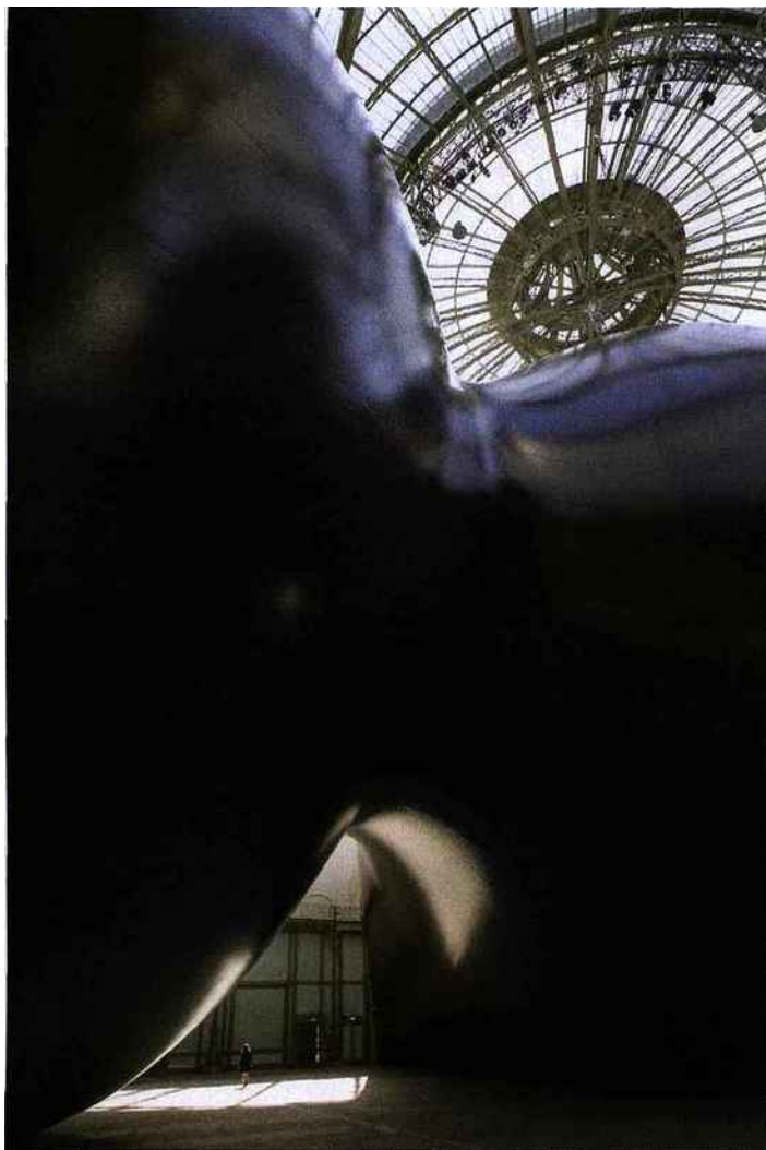
L'artiste britannique Anish Kapoor, pour son exposition internationale Monumenta, a fait appel à la PME française Serge Ferrari. C'est leur troisième collaboration.